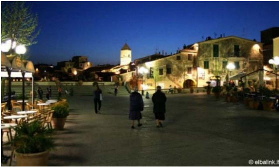
Piazza Centrale di Capoliveri