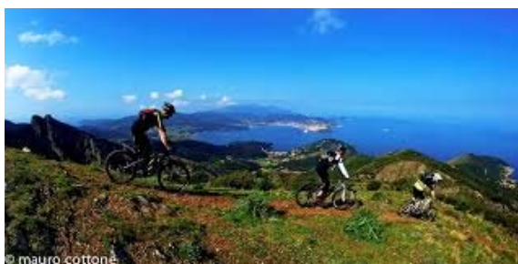
Vista dalla MTB

Punta Ala sarà il punto di ritrovo, con imbarco il Sabato in tarda mattinata , drink di benvenuto e sistemazione nelle cabine dopo aver fatto cambusa.