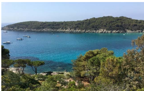
Fetovaia (Isola d'Elba)

L'incantevole armonia architettonica di Capoliveri si completa con le numerose attrattive, le assortite boutique, gli ottimi ristoranti, e dove in una dei quali ci recheremo a cenare.