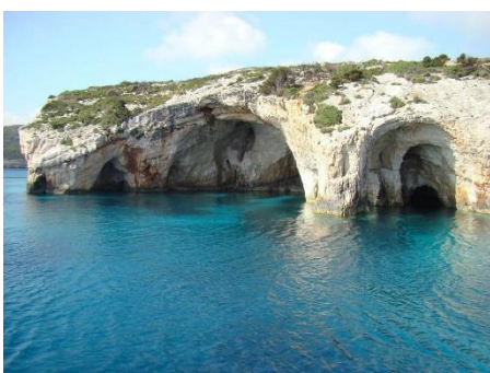
Green Cave - Ravnik

Nel pomeriggio proseguiamo costeggiando Lagosta al traverso di Lucica , Zaklopatica che è un piccolo porticciolo con numerosi ristoranti tra cui uno famoso che consigliamo, si chiama Augusta Insula, ci infiliamo tra Prebza e l'isola di Mrcara che è una riserva di caccia.