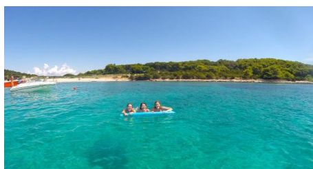
Spiaggia di Budicovak