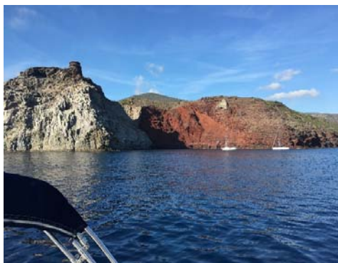
Cala Rossa (Isola di Capraia)